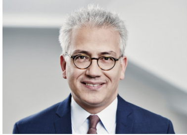
Tarek Al-Wazir Hessischer Minister für Wirtschaft, Energie, Verkehr und Wohnen

Die Energiewende ist eine enorme Aufgabe mit enormen Chancen – für das Weltklima, für eine verlässliche und dauerhaft bezahlbare Energieversorgung, für eine nachhaltige Stärkung des Wirtschaftsstandorts Hessen. Zu ihren Herausforderungen zählt die Integration der erneuerbaren Energien in die bestehende Infrastruktur. Die Wasserstoff- und Brennstoffzellen-Technologie bietet eine Möglichkeit, als Puffer für Stromüberschüsse eine schwankende Erzeugung mit den Zyklen des Verbrauchs in Einklang zu bringen. Zahlreiche Modellprojekte zeigen, dass die Technik erprobt ist und an der Schwelle zur Marktreife steht.